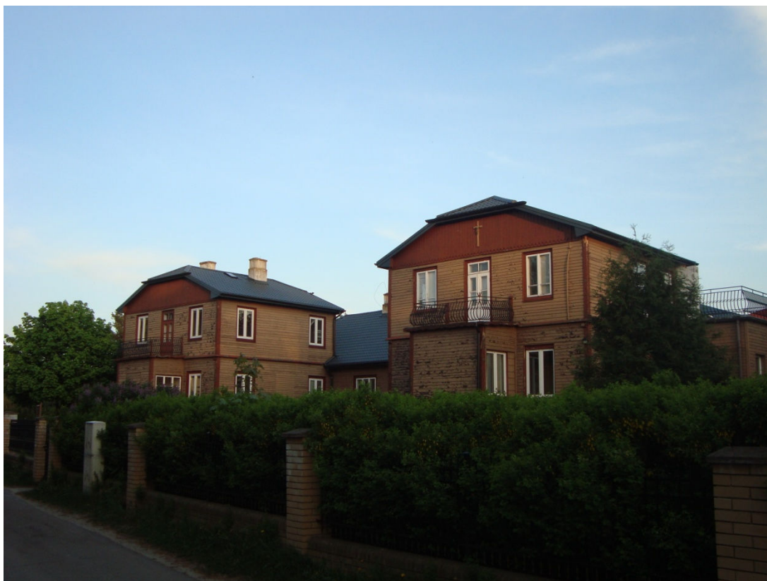
Były klasztor sióstr szarytek. Siedziba lubelskiego seminarium duchownego w okresie II wojny światowej