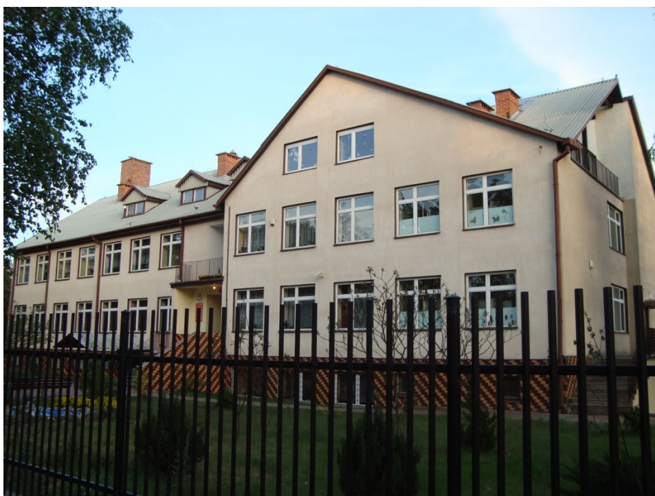
Zespół Szkół w Krężnicy Jarej .