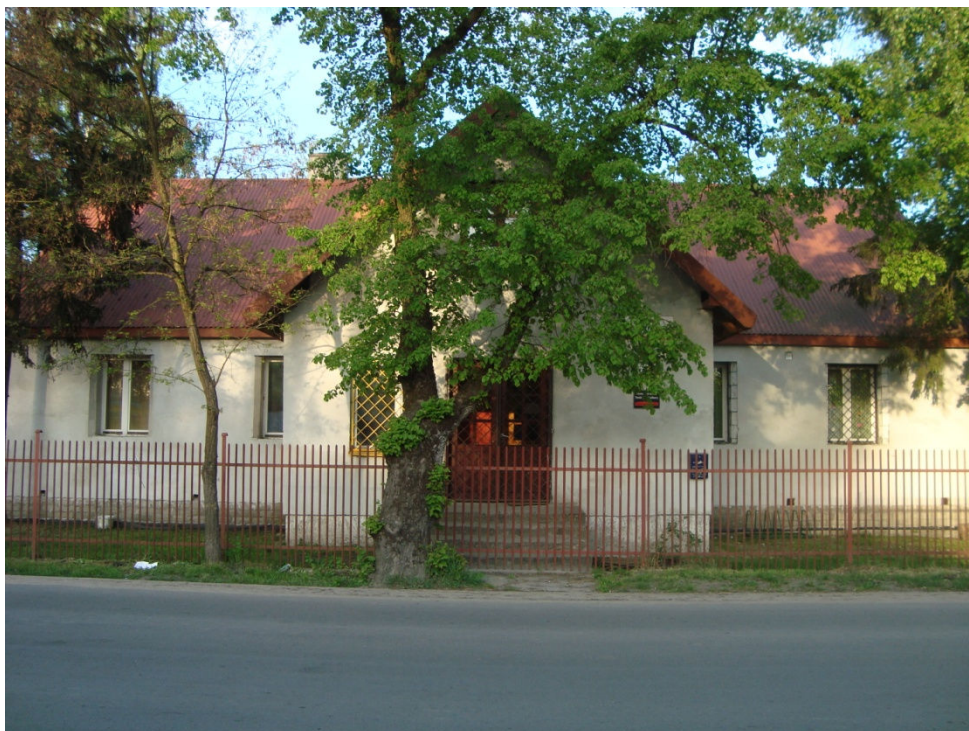
Stara szkoła w Krężnicy Jarej.