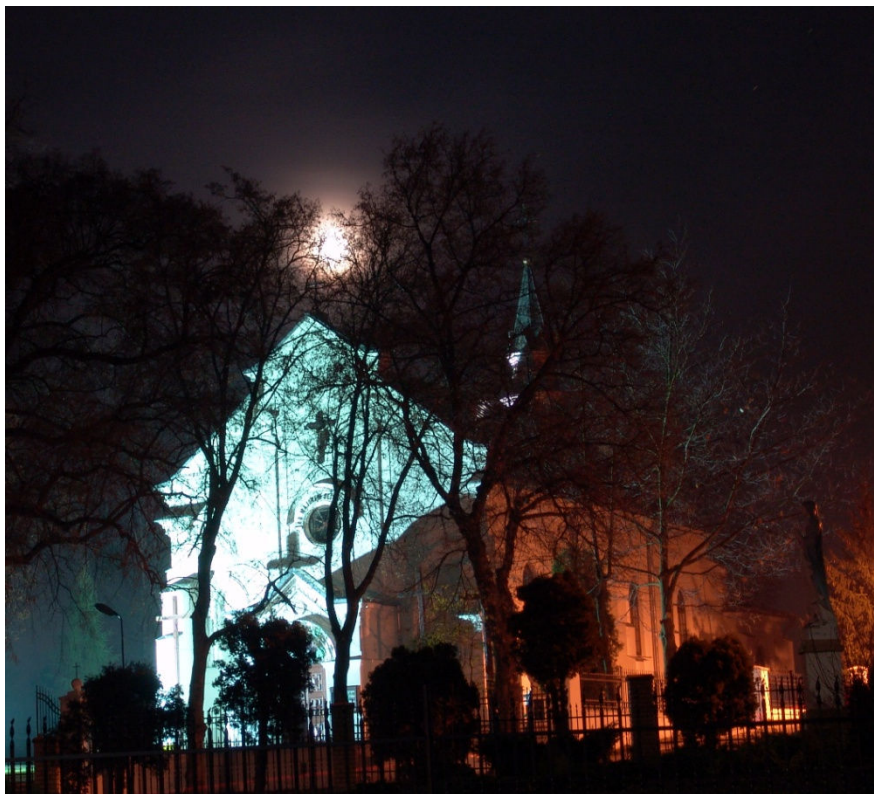
Kościół pod wezwaniem św. Floriana w Krężnicy Jarej.