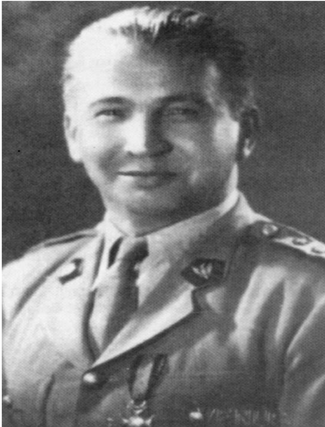
Leopold Okulicki „Niedźwiadek” komendant AK do 19 stycznia 1945 r.