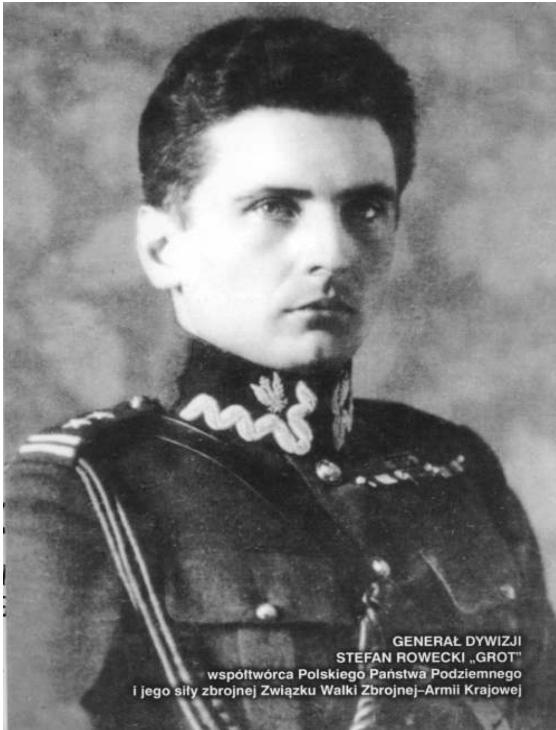
GENERAL DYWIZJI STEFAN ROWECKI „GROT” współtwórca Polskiego Państwa Podziemnego i jego siły zbrojnejs Związku Walki Zbrojnej-Armii Krajowej

Stefan Rowecki „Grot” komendant AK do 30 maja 1943 r.