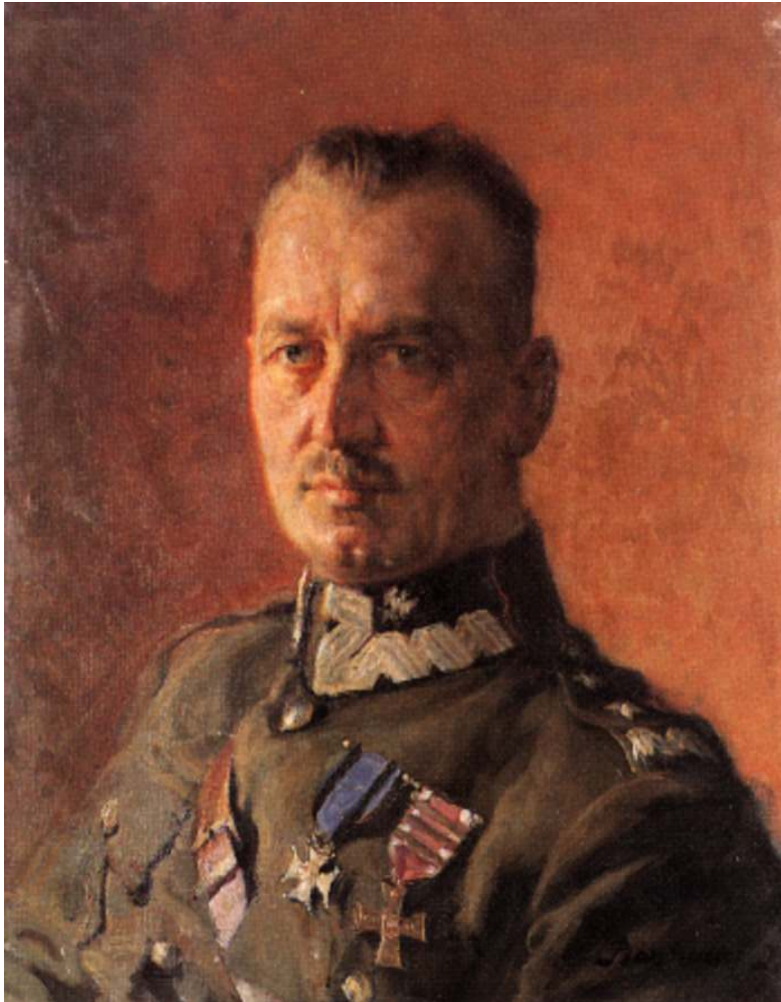
Władysław Sikorski Naczelnny Wódz Polskich Sił Zbrojnych