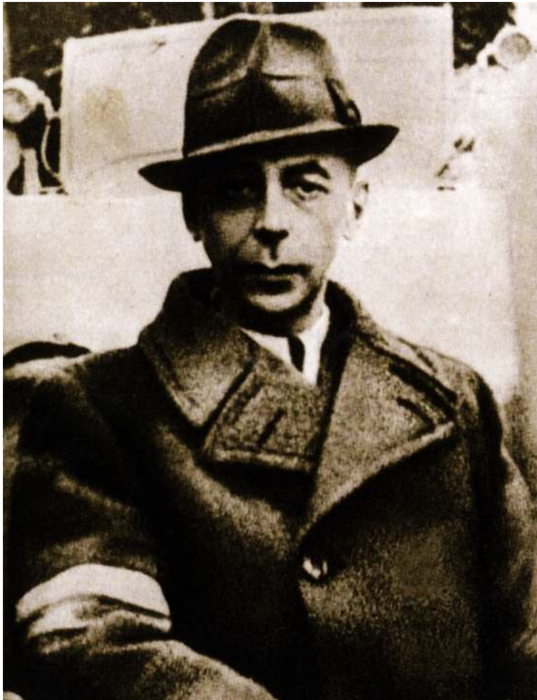
Tadeusz Komorowski „Bór” komendant AK do 2 października 1944 roku